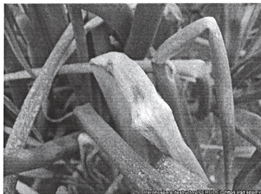
Mana cepei ( Perenospora destructor ), ( https://gd.eppo.int/taxon/PERODE/photos )